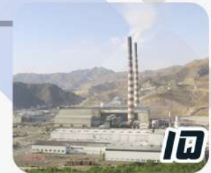
نیرو صنعت سرچشمه