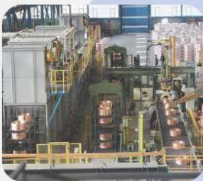
شرکت صنایع مس شهید باهنر کرمان