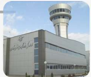
پروژه فرودگاه کرمان