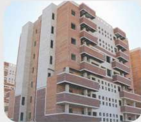
پروژه کارکنان دادگستری کرمان