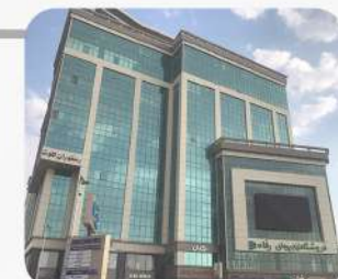
پروژه برج اول کرمان