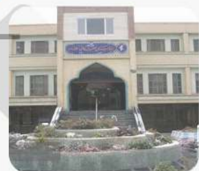
تاسیسات بیمارستان الزهرا