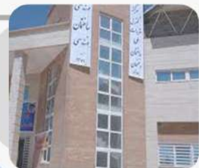
ساختمان سازمان نظام مهندسی کرمان