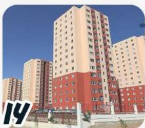
پروژه مسکونی سازمان هلال احمر کرمان