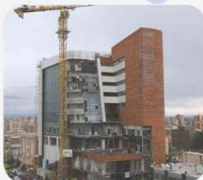
اطلس کلینیک در خیابان استقلال