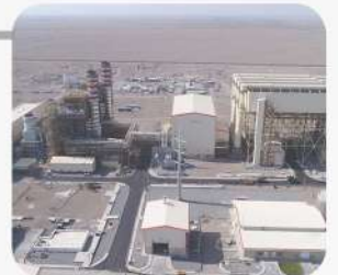
پروژه نیروگاه سیکل ترکیبی سمنگان سیرجان