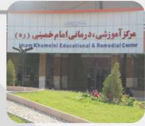
بیمارستان امام خمینی جیرفت