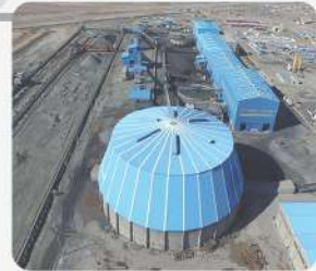
پروژه فولاد ایرانیان سیرجان در بردسیر