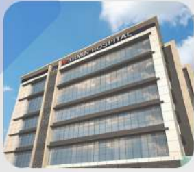
پروژه فاز ۱ و ۲ بیمارستان آرمین