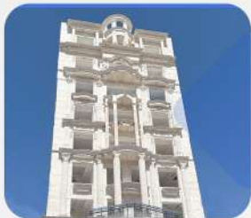
پروژه آقای عالم زاده در هزار و یک شب