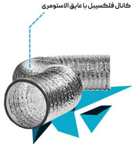
کانال فلکسیبل با عایق الاستومری