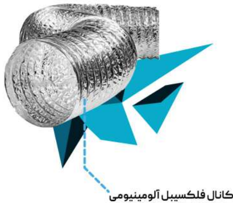
کانال فلکسیبل آلومینیومی