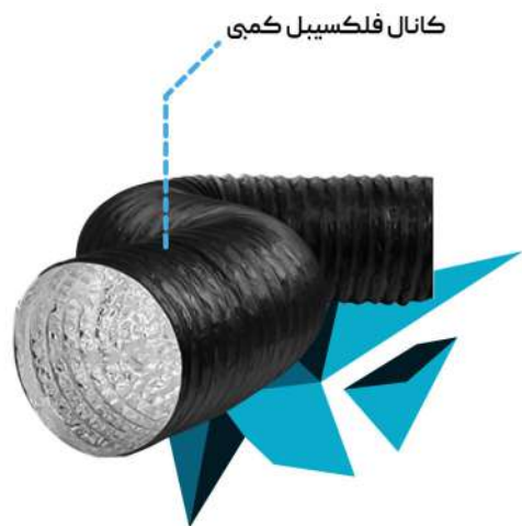
کانال فلکسیبل کمی