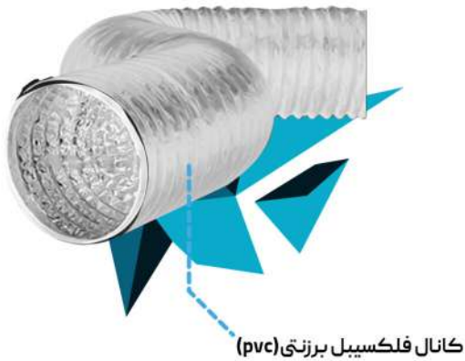
کانال فلکسیبل برزنتی (pvc)

از این کانال در سیستم های تهویه مطبوع، اگزاست فن ها، و هر جایی که استفاده از کانال های گالوانیزه مقدور نباشد، کاربرد دارد. از این محصول به علت بهداشتی بودنش، در صنایع غذایی مانند کارخانجات غذایی، رستوران ها، انبار های غذایی استفاده می شود.